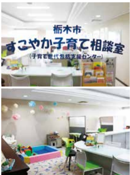
明るい雰囲気の相談室内

●すこやか子育て相談室（栃木保健福祉センター内・今泉町2丁目） 受付 平日8時30分～17時（受付時間外に相談希望の方はご連絡ください） 問合せ・電話相談 ☎(25)3505