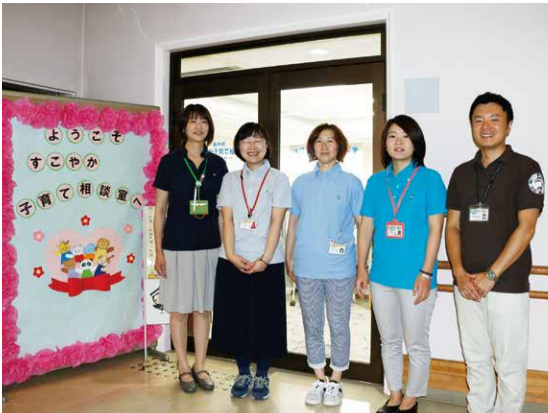
私たちが相談をお受けします！（すこやか子育て相談室の専門職員）

※ネウボラとは？ 「福祉の国」と呼ばれるフィンランドで、妊娠から出産、子どもの就学前までの間、親子とその家族を支援する施設です。