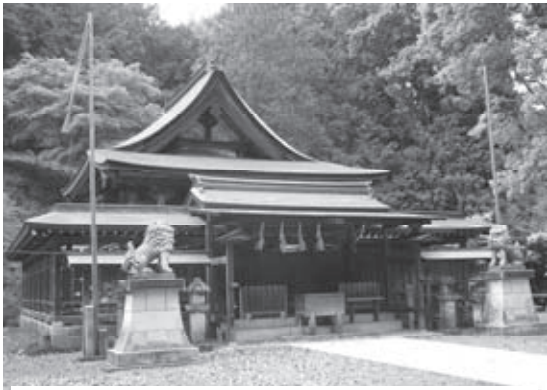
本殿左方の柱には、飛騨の工匠左甚五郎の作と伝えられる瓜の彫刻があります。

村檜神社の創建は飛鳥時代中期の大化2年(646年)と伝えられ、本殿は室町時代後期の天文22年(1553年)に建てられました。三間社春日(さんげんしゃかす