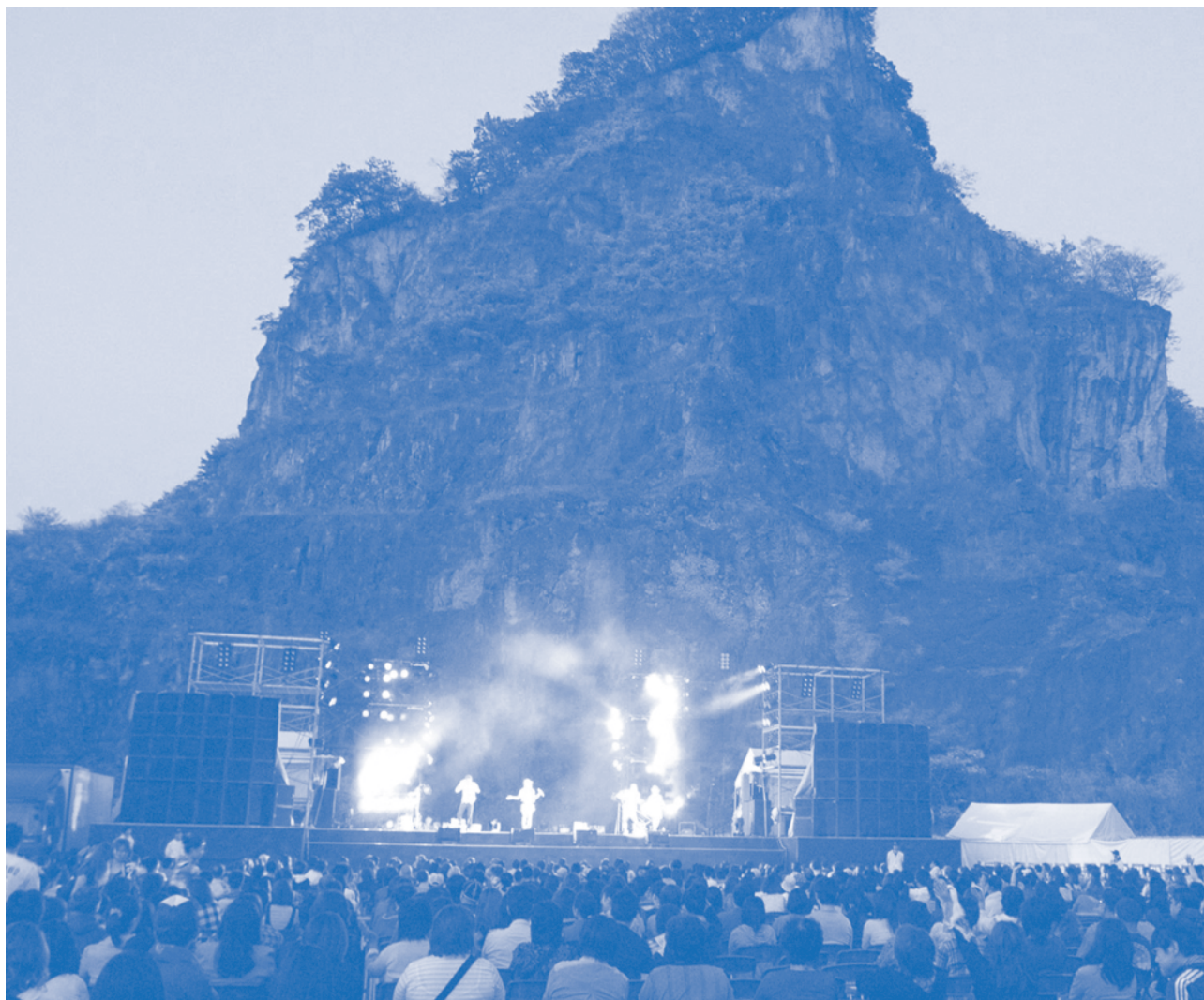
岩船山クリフステージ（解説は8ページに記載）

発行／栃木市・岩舟町合併協議会 編集／栃木市・岩舟町合併協議会事務局 〒329-4492 栃木県栃木市大平町富田558番地（栃木市大平総合支所内） TEL0282-43-9203 FAX0282-43-8818 [ホームページ] http://www.city.tochigi.lg.jp/gappei/ti/ [Eメール] info-ti@totigi-gappei.jp