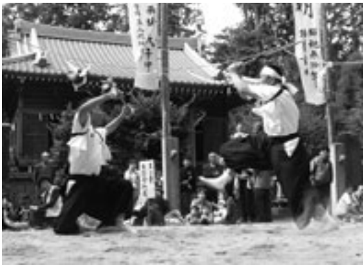
境内に作られた土俵の上で、棒と棒、棒と太刀の渡り合いの演技が行われます。

木の杖術は、都賀町木の人々によって長い間伝えられてきた小天狗流を名乗る杖術で、木八幡宮の秋の祭礼で2年に1度奉納されています。この杖術は、