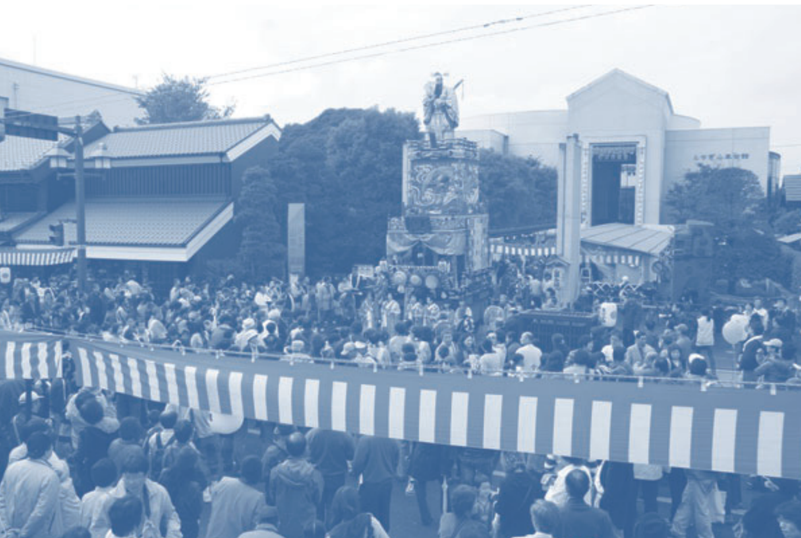
とちぎ秋まつり（解説は 10 ページに記載）

発行／栃木市・岩舟町合併協議会 編集／栃木市・岩舟町合併協議会事務局 〒329-4492 栃木県栃木市大平町富田558番地（栃木市大平総合支所内） TEL0282-43-9203 FAX0282-43-8818 [ホームページ] http://www.city.tochigi.lg.jp/gappei/ti/ [Eメール] info-ti@totigi-gappei.jp