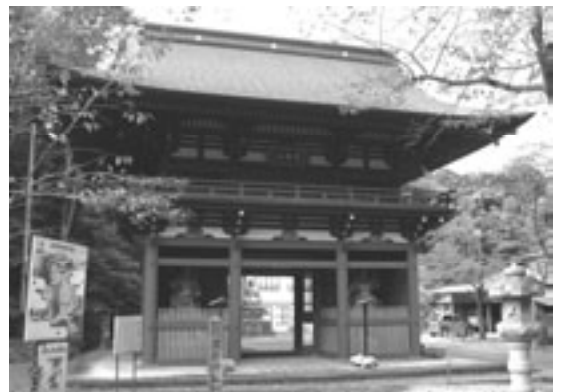
表参道の約600段の石段を上った山腹にあります。

岩船山山頂の高勝寺は奈良時代後期の開山で、山門(仁王門)は江戸時代中期の寛保2年(1742年)に再建されたものです。山門は、三間一戸の入母屋造、銅版柿葺きの楼門(2階建てで上部に屋根を持つ門)です。高さ約13m、幅約9m、奥行き約5.3m、大きさでは県内一の規模で、県指定有形文化財に指定されています。 所在地 岩舟町大字静3番地