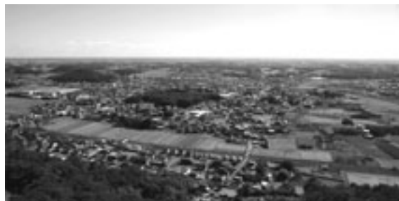
岩船山から東京方面を望む。

※ 住所地による会場の指定はありません。 栃木市民、岩舟町民の皆様は、いずれの会場にも参加することができます。