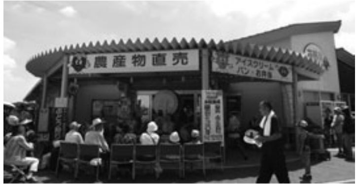
みかも山東ゾーンの観光拠点として期待される「いわふねフルーツパーク」花野果（はなやか）ひろば