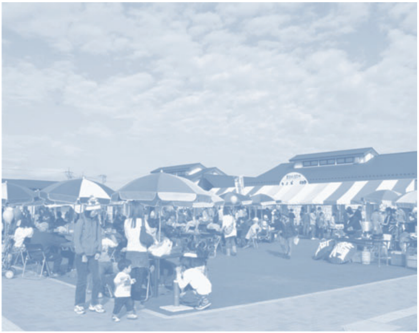
道の駅にしかた（解説は8ページに記載）

発行／栃木市・岩舟町合併協議会 編集／栃木市・岩舟町合併協議会事務局 〒329-4492 栃木県栃木市大平町富田558番地（栃木市大平総合支所内） TEL0282-43-9203 FAX0282-43-8818 [ホームページ] http://www.city.tochigi.lg.jp/gappei/ti/ [Eメール] info-ti@totigi-gappei.jp