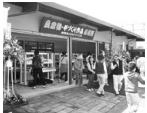
季節には近くの小川でホテルの乱舞が見られます。

大柿村ほたるの里より処は、国道293号線沿いの元保育所を都賀町商工会がアンテナショップとして改装し、地域活性化を目指す地元の方々により地元農産物、農産加工品、手作り作品等を販売しているほか、地元そば粉を使用した手打ちそばも提供しています。また、そば打