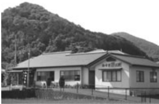
みずぎ庵隣のみずぎ夢工房では、個人や団体（20名まで）で、そば打ち体験ができます。

岩舟町には、農村に住む人々の豊かなコミュニティづくりと、みんなが主役となって活躍できる農村レストラン「みずぎ庵」と「円仁庵」があります。