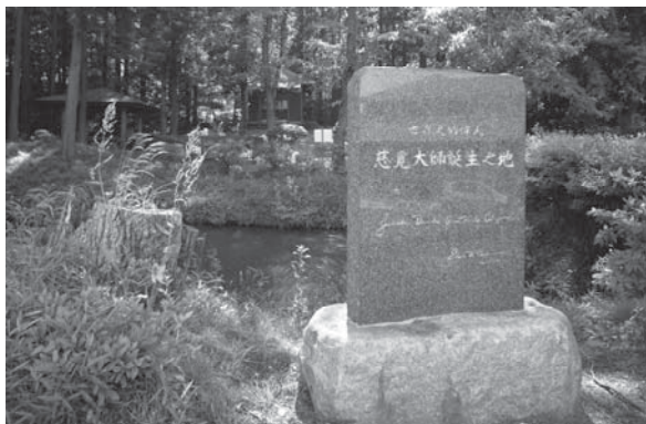
円仁の研究者としても有名なライシャワー元駐日大使が、この地を訪れています。

円仁は、平安時代に遣唐使として唐に渡り、帰国後、日本の天台宗を大成させた高僧です。約10年にも及んだ唐の旅の記録