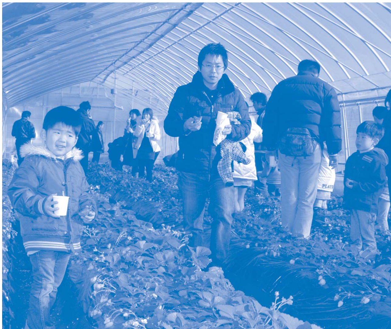
いわふねフルーツパーク（解説は6ページに記載）

発行／栃木市・岩舟町合併協議会 編集／栃木市・岩舟町合併協議会事務局 〒329-4492 栃木県栃木市大平町富田558番地（栃木市大平総合支所内） TEL0282-43-9203 FAX0282-43-8818 [ホームページ] http://www.city.tochigi.lg.jp/gappei/ti/ [Eメール] info-ti@totigi-gappei.jp