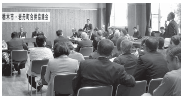
第9回合併協議会の会議の様子。

第9回栃木市・岩舟町合併協議会が、平成24年11月12日(月)午後2時から、栃木市国府公民館大交流室で開催されました。