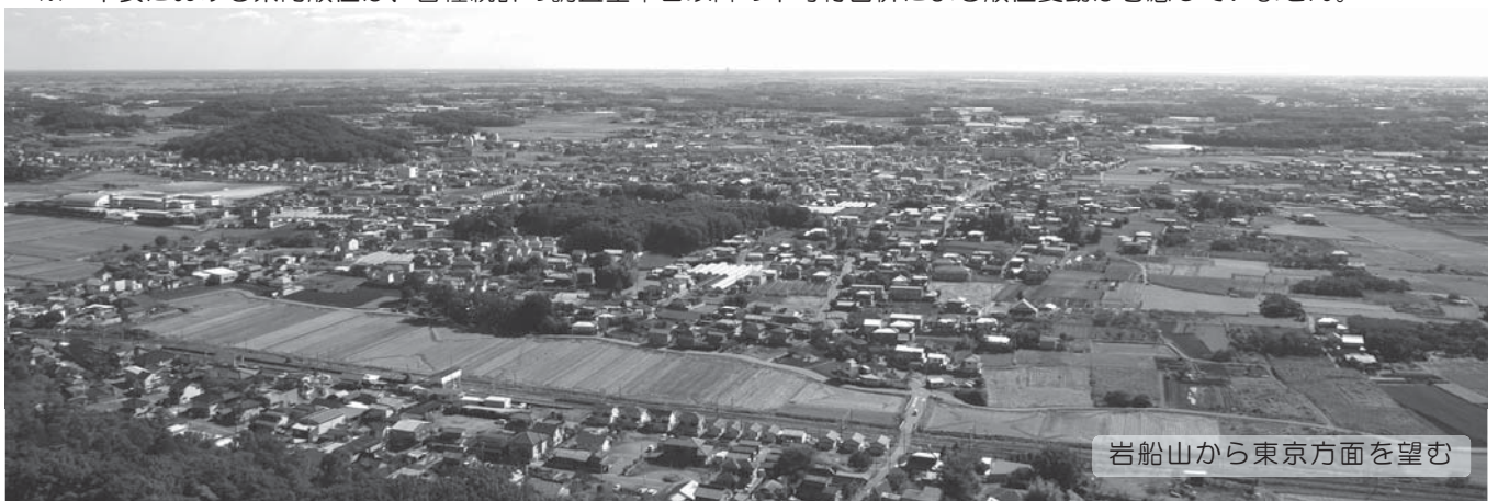
岩船山から東京方面を望む

※ 本表における県内順位は、各種統計の調査基準日以降の市町村合併による順位変動は考慮していません。