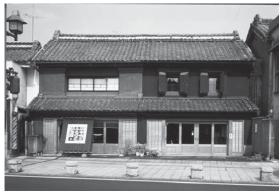
記念館の建物は、江戸末期に建てられた見世蔵を「山本有三記念会」が改修、整備したものです。