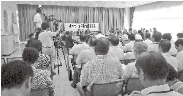
第12回合併協議会の様子

第12回栃木市・岩舟町合併協議会が平成25年7月29日に岩舟町の健康福祉センター「遊楽々館」検診室で開催されました。