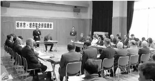
第 13 回合併協議会の様子

第 13 回栃木市・岩舟町合併協議会が平成 25 年 11 月 25 日に栃木市の国府公民館大交流室で開催されました。