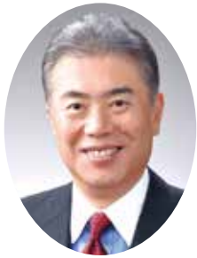
鈴木 俊美（栃木市長）

2月の記録的な大雪により被害に遭われました皆様には、心からお見舞いを申し上げます。特に農林業への被害は甚大であり、現在栃木市及び岩舟町ともに歩調を合わせ復旧に向けた支援策を検討し