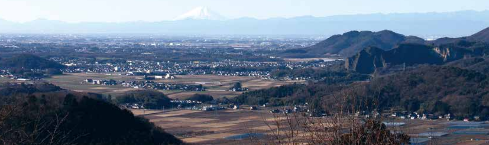
太平山から岩舟町方向の富士山を望む

4月5日、栃木市と岩舟町は合併します。 “自然” “歴史” “文化” が息づき “みんな” が笑顔の あったか栃木市を目指して、新たな1ページを開きます。