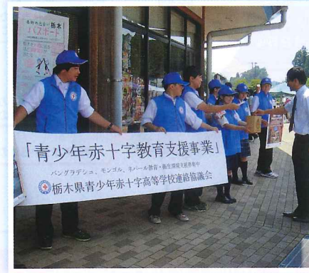
街頭募金を行うJRC高等部メンバー

世界の平和と人道の実現のため、未来を担う青少年が実践活動を通して自ら「気づき、考え、実行」できる学びの機会を提供します。