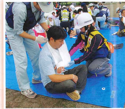
訓練で傷病者の手当てを行う救急法奉仕団と接骨・整骨災害救護奉仕団