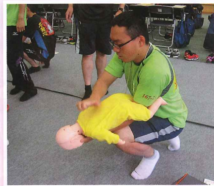
幼児安全法での異物除去