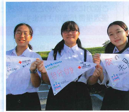
防災の大切さを伝えるメッセージ