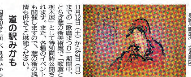
喜多川歌麿の「女達磨図」