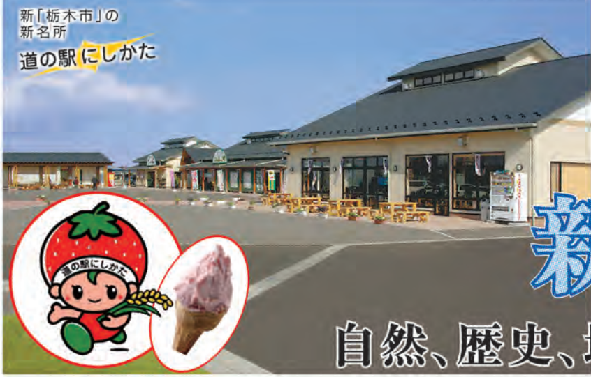
新「栃木市」の新名所 道の駅にしかた

道の駅にしかたの一番のお薦めは手作りのジェラートです。中でも新鮮な牛乳と、西方町の特産品である「いちご(とちおとめ)」をせいたくに混ぜ合わせたジェラートが大人気です。食感のなめらかさが自慢です。他にも季節感あふれるオリジナルジェラートを取りそろえています。また、2周年記念感謝祭が11月19日(土)から23日(水)まで開催されます。さまざまなイベントを用意してお待ちしています。