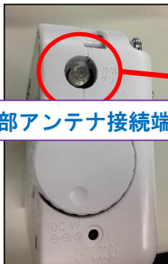
外部アンテナ接続端子