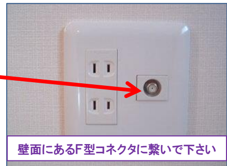
壁面にあるF型コネクタに繋いで下さい