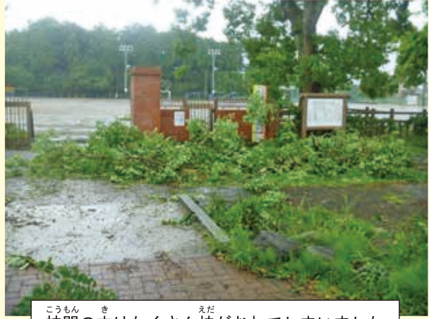
こうもん き えだ 校門の木はたくさん枝がおれてしまいました