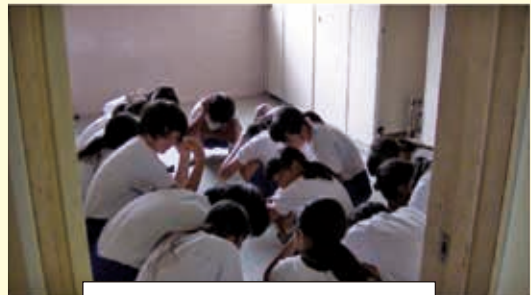
だんごむしのしせいになろう

たつまきがきたときも「だんごむし」のしせいになって、頭をまもることがたいせつなんだね。