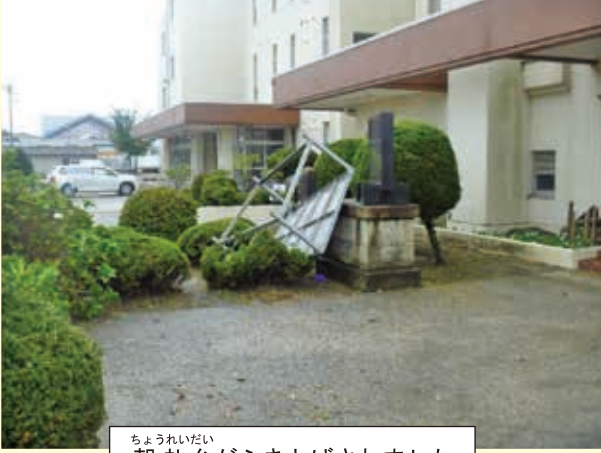
ちょうれいだい 朝礼台がふきとばされました