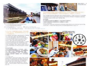
ジェットスター機内誌秋号