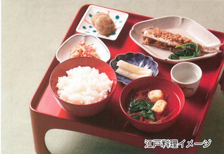
江戸料理イメージ