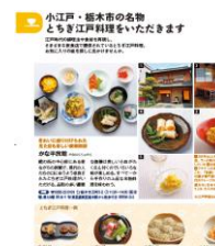
ことりっぷ 2月号 (予定)