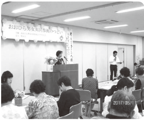
おひら男女共同参画のつどい