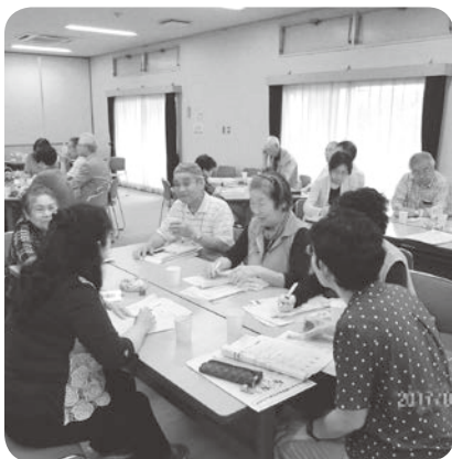
おしゃべりティータイム