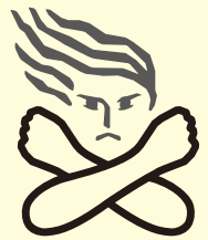
女性に対する暴力根絶のためのシンボルマーク