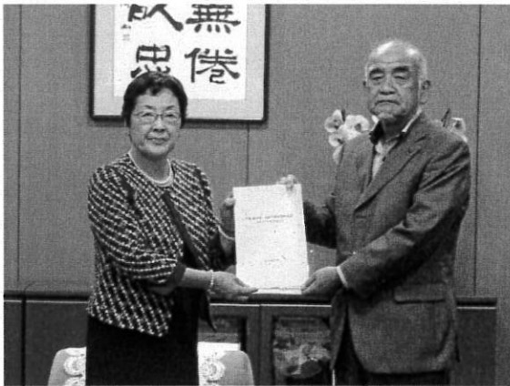
【市長に事業計画書を提出する大塚会長】