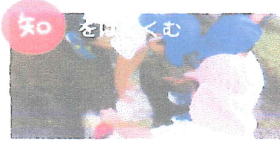
～考える力・決断力～