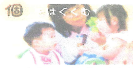
～一人ひとりが主役・自立心～