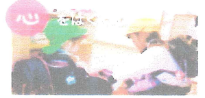
～感動・愛・思いやり～