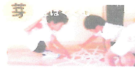
～意欲・想像力・創造力～