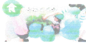
～食に興味を持つ・事を食べる (嬉しかった事/悲しかった事/つらかった事)～