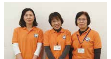
▲認知症初期集中支援チーム