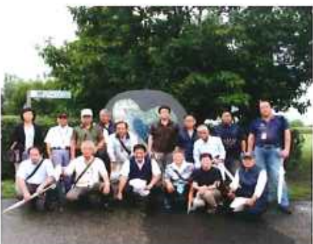
9/2渡良瀬遊水地フェスティバル

予定されている「初市祭」においても、子どもたちの安全を守るため見守り活動を実施する予定です。