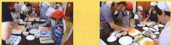
8/26 藤岡子どもフェスティバル

犯罪に巻き込まれないよう、地域の子供たちの健やかな成長を見守ることが私たちの役目と思っています。