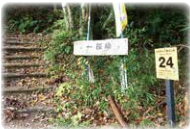
位置が確認できる表示の設置

これは、初心者でも安全にハイキングを楽しんでもらうための案内表示としての役割のほかに、レスキューポイントを兼ねており、万が一の救助活動が必要になった場合に迅速な救助活動を行う際の目印としても活用されます。