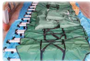
合計11張の簡易テント

昨年購入分と合わせて11張りの簡易テントは、自治会等の地域のイベントの際に借用的に使用することができます。