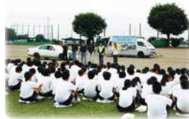
真剣に講習を受ける中学生

通学のため自転車を利用する機会が多い中学生を対象に、交通安全・交通ルールを大切にすることを意識の向上を育む事業となりました。