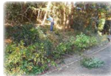
アジサイ周辺の環境保全

高木の枝を剪定することで、アジサイの日当たりを確保することとあわせて、林道の安全性の確保につなげます。