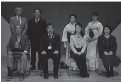
平成30年度 栃木市文化マイスター認定者