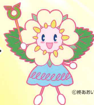
みずの妖精 ミーナ