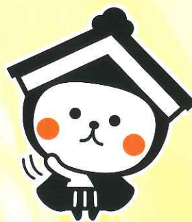
栃木市マスコットキャラクター とちいち

※参加企業は決定次第 (6月中旬頃)、栃木労働局、栃木市及び壬生町のホームページ等で公表します。