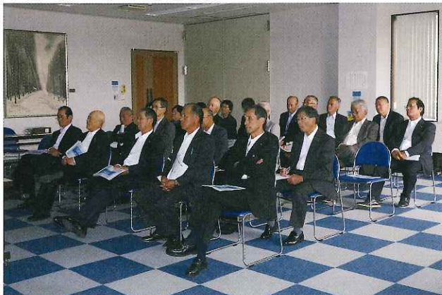
農地利用最適化活動について研修

当日は北杜市の活動がテレビで紹介 された時のビデオを視聴した後、 農業委員会事務局からの説明と質疑 応答があり、農業分野で企業参入した スプラウトやトマトの栽培工場を外 から見学させていただき、約2時間の 有意義な時間を過ごすことができました。