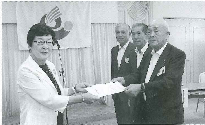
大川市長に意見書を提出

イ. 現場における農地のあっせんへの進め方について、市、市農業公社、農業委員会及びJA等が連携を密にして調整を図り、出し手受け手の合意の取り付けに努めるべきと考えますので、検討くださるようご提案いたします。