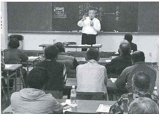
今年度は税制改正についての説明会を開催

―全国農業新聞を購読してみませんか― (発行：全国農業会議所 毎週金曜日発行 B3版8〜10頁建) 購読料…月700円、年8,400円 〔送料、税込み〕 全国農業新聞は、農業者の公的代表機関である農業委員会組織が発行する農業総合専門紙です。 「週刊」の時間的利点を生かし、情報がわかりやすいよう解説的にまとめています。 また、多くの読者の皆様に満足して頂けるよう、家族全員が楽しめる記事も充実しています。