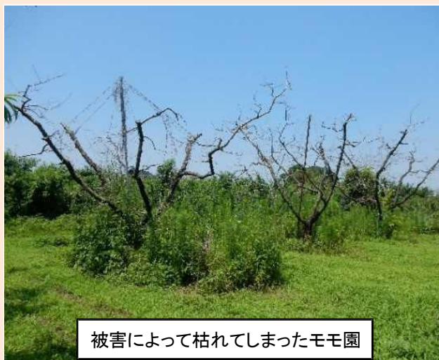
被害によって枯れてしまったモモ園