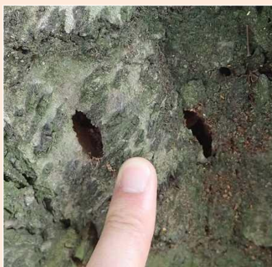
幹に開いた成虫の羽化脱出口