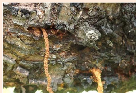
うどん状のフラスを幹から排出