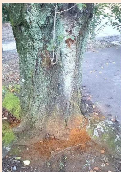
赤茶色のフラスが株元に積もったサクラ(左)とモモ(右)