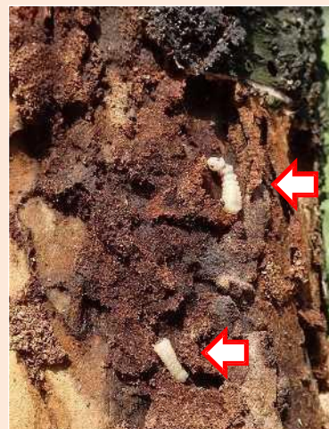
樹木内部を食い荒らす幼虫