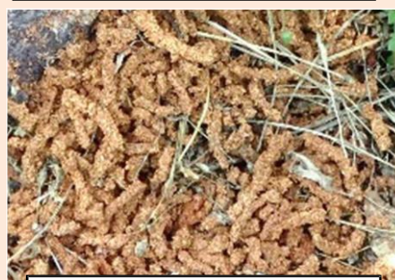
地表に落下したフラス