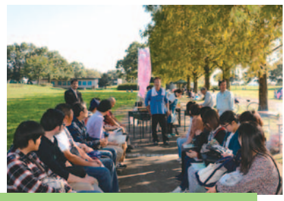
婚活事業「ハートランドコン」