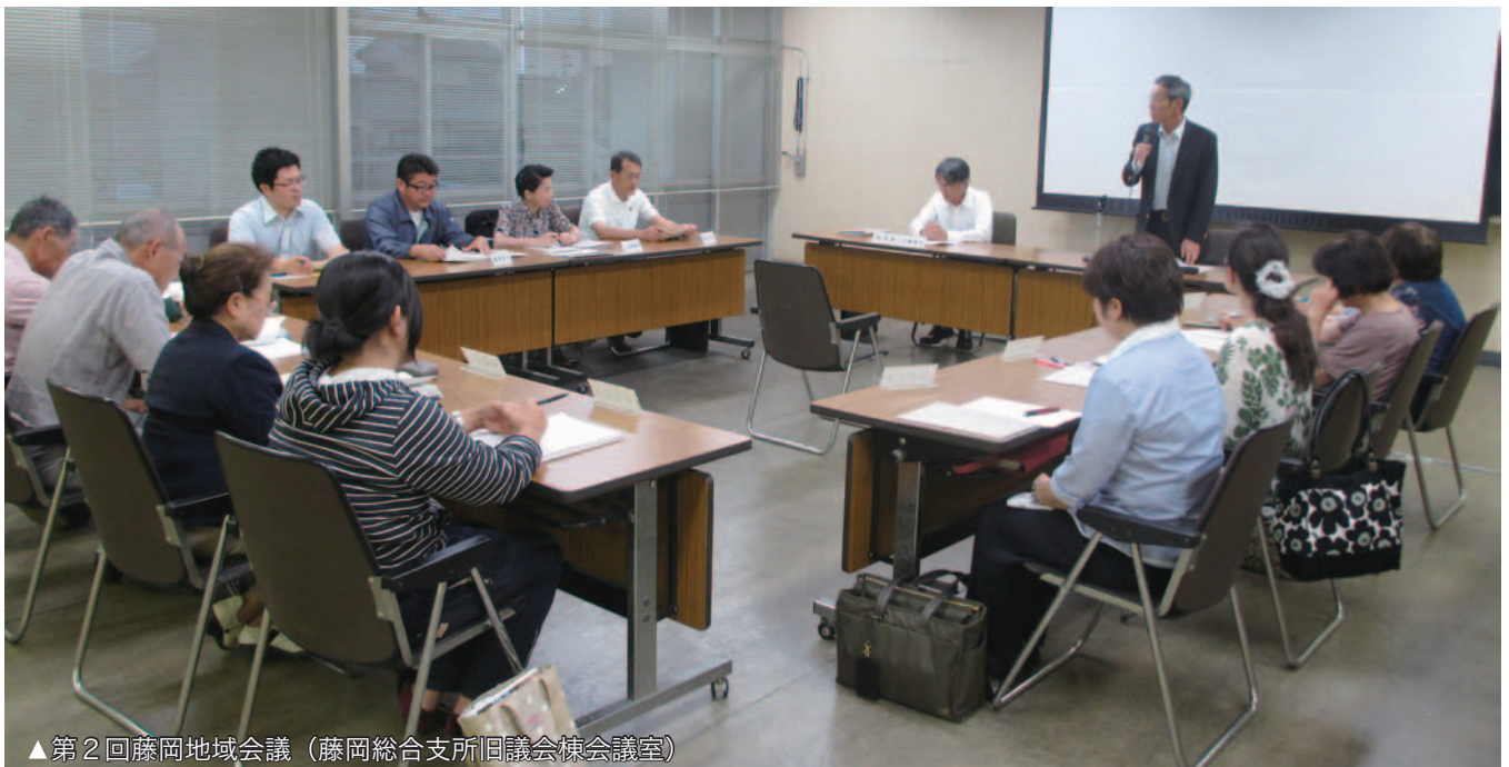
▲第2回藤岡地域会議（藤岡総合支所旧議会棟会議室）