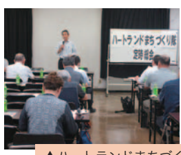
地域会議と連携強化