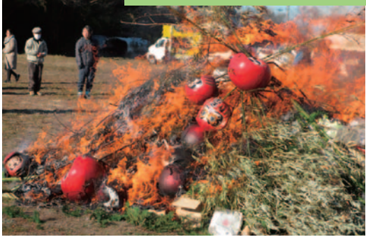
伝統行事の復活「どんど焼き」