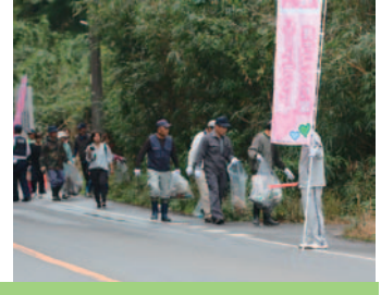
力を合わせて「クリーン作戦」