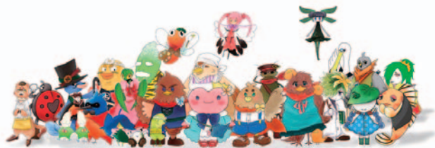
渡良瀬遊水地キャラクター