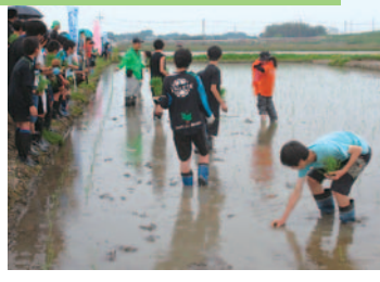
自分の手で「米作り体験」

ハートランドまちづくり隊は、藤岡地域全域を対象に自主的なまちづくり活動を行う団体（栃木市認定まちづくり実働組織）です。昨年度は、本格的な事業に着手した最初の年度でしたが、会員の皆さんが一丸となって様々な事業を展開し、各会場はたくさんの方の参加者でにぎわいました。（掲載した写真は事業の一例です。） ハートランドまちづくり隊では、今年度もいろいろな事業を計画している予定です。また、自ら活動に参加する会員も常時募集中とのことです。ぜひ、ご注目ください。