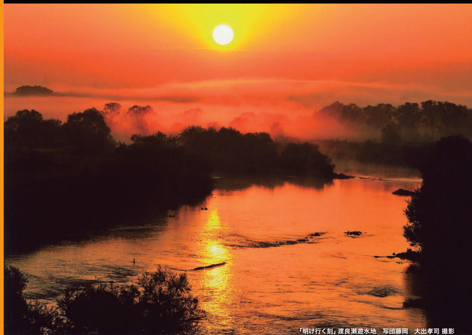
「明け行く刻」 渡良瀬遊水地 写団藤岡 大出孝司 撮影