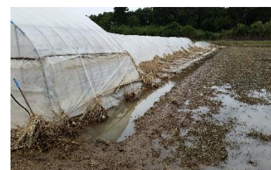
倒壊したビニールハウス