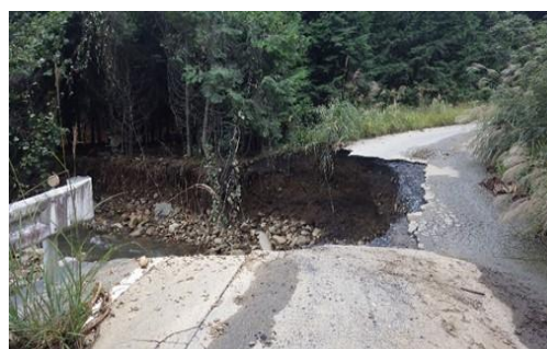
土石流により崩落した真上男丸柏木線