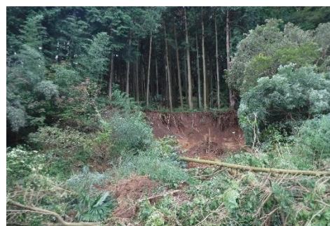
西方町の土砂崩れ