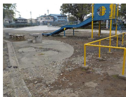
出水により表土が流出したうずま公園