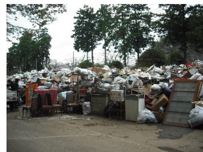
災害ごみ仮置き場（大平総合運動公園）