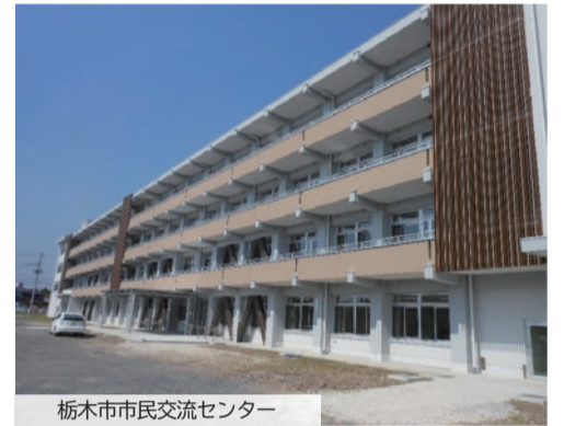
栃木市市民交流センター