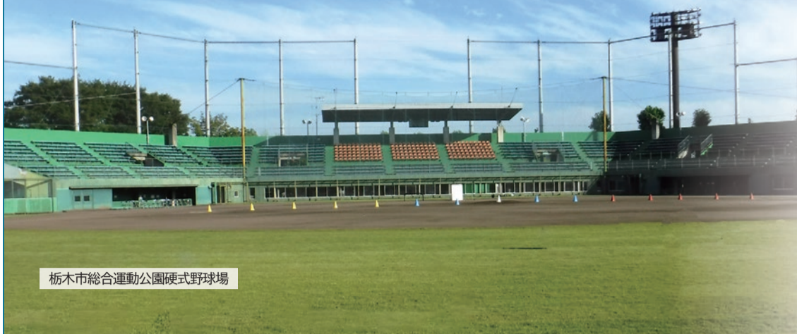
栃木市総合運動公園硬式野球場

官民相互の活性化を図るため、市の施設に愛称を付ける権利を付与する「ネーミングライツ事業」に参加いただける企業等を募集します。公共施設に愛称を付けることで、宣伝効果や企業イメージの向上が期待できます。