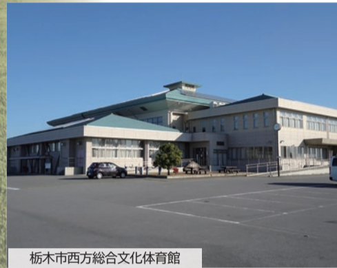
栃木市西方総合文化体育館