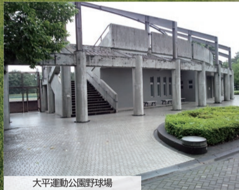
大平運動公園野球場