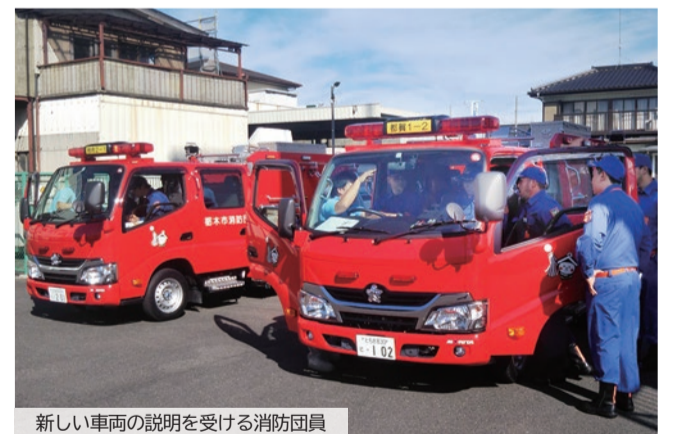
新しい車両の説明を受ける消防団員

発生直後の10月14日には、学校の枠を超えた高校生サークル「とちぎ高校生蔵部」の皆さんが、SNSでボランティアを募り、ボランティアセンターが本格稼働する前にいち早く、市内の復旧活動を行いました(活動の様子を撮影した、表紙中央上段の写真も併せてご覧ください)。