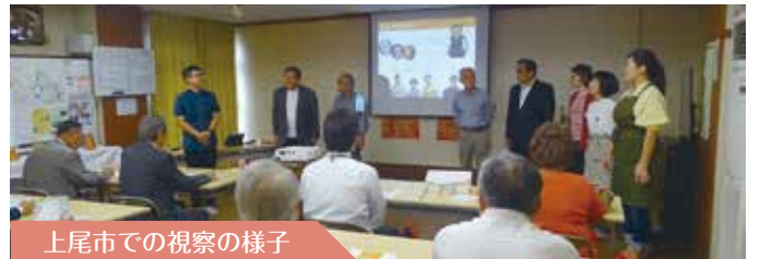
上尾市での視察の様子

多くの家庭では、家を出産し、年上の子どもも弟妹を背負い、半纏の裾を引きずりながら育児を手伝い、家族の人が病気になるれば全員で対応し、多くの方が自宅で亡くなっていました。冠婚葬祭は地域住民によって支えられ、多少窮屈なところもありましたが、住民は安心して日々の生活を営むことができ、家族や地域社会が小さな福祉単位として機能していたような気がいたします。