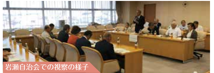
岩瀬自治会での視察の様子

民間企業や地元の小中学校、大学と連携した自治会運営や、NPO法人を立ち上げて地域を巻き込む運営をしている点など特色ある活動を学ぶことができました。