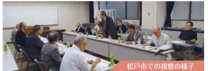
松戸市での視察の様子