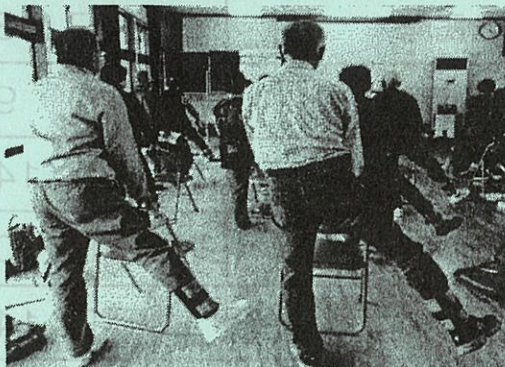
～磯山クラブ(真弓集会所)～