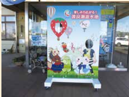
顔出しパネル全4基の内1基(渡良瀬の里)