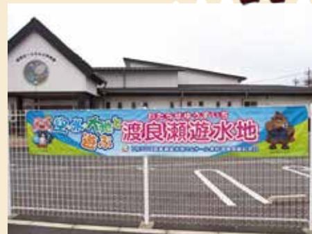
横断幕全20枚の内1枚(藤岡はーとらんど保育園)