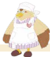
ヨシキリおばさん▶