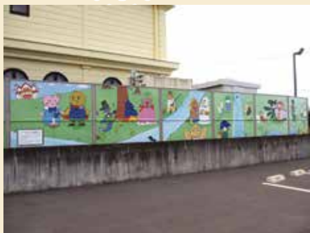
目隠しパネル(渡良瀬遊水地ハートランド城北側フェンス)