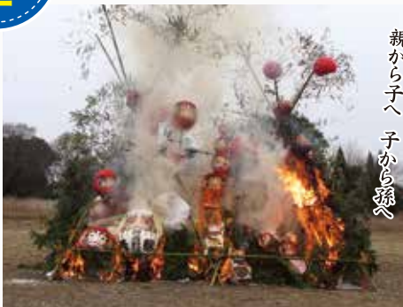
人々が見守る中、やぐらは一気に炎に包まれました。