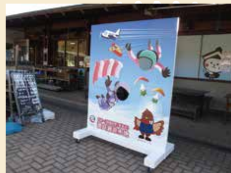
顔出しパネル全4基の内1基(道の駅みかも)