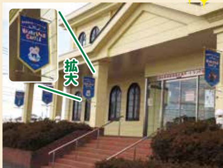
フラッグ(渡良瀬遊水地ハートランド城)