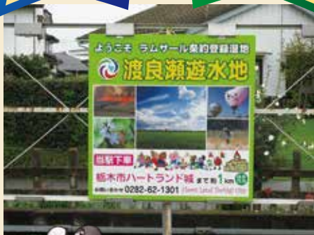
渡良瀬遊水地案内看板(藤岡駅構内) ※平成30年度から継続して掲出中