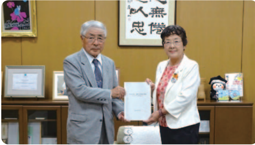
大川市長(右)に事業計画書を提出する大塚都賀地域会議会長

令和元年10月9日(水)、各地域会議から市長へ令和2年度実施分地域予算事業計画書を提出いたしました。