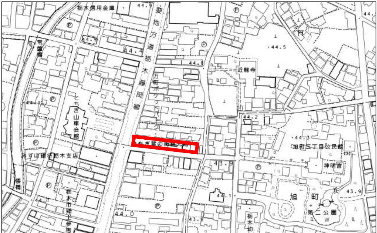
とちぎ蔵の街観光館 案内図