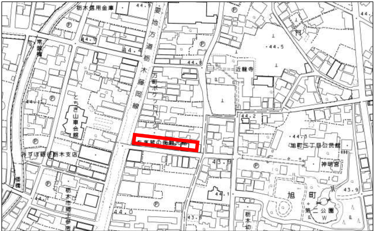
とちぎ蔵の街観光館 案内図