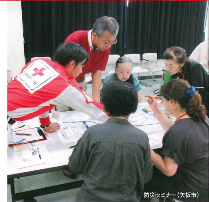
防災セミナー(矢板市)