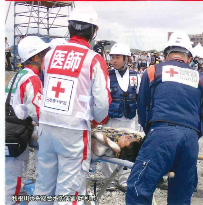
利根川水系総合水防演習(足利市)