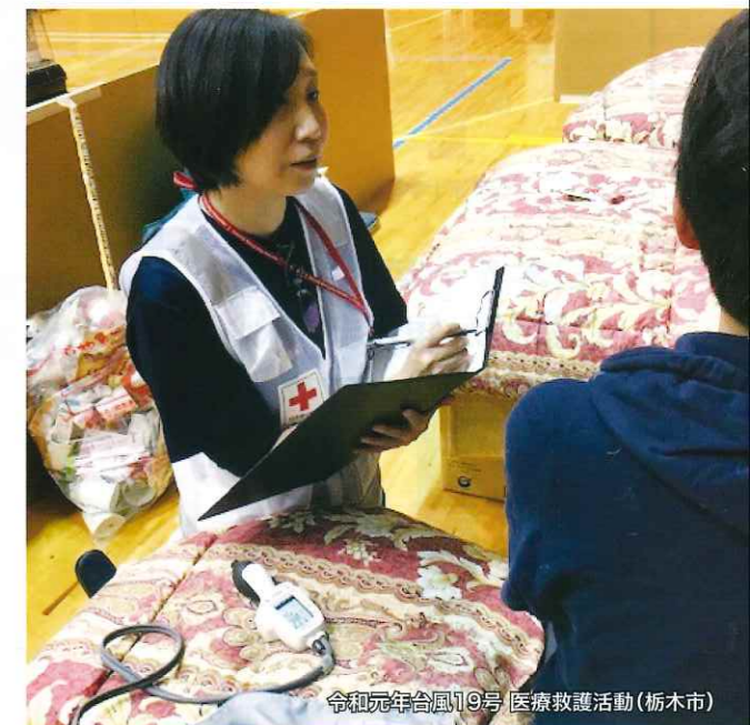
令和元年台風19号 医療救護活動(栃木市)

皆様の温かいお気持ちとともに これからはもひたむきに 救うことをつづけてまいります。