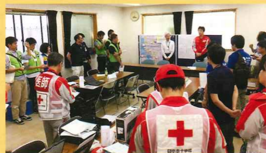
被災地での災害医療ミーティングの様子