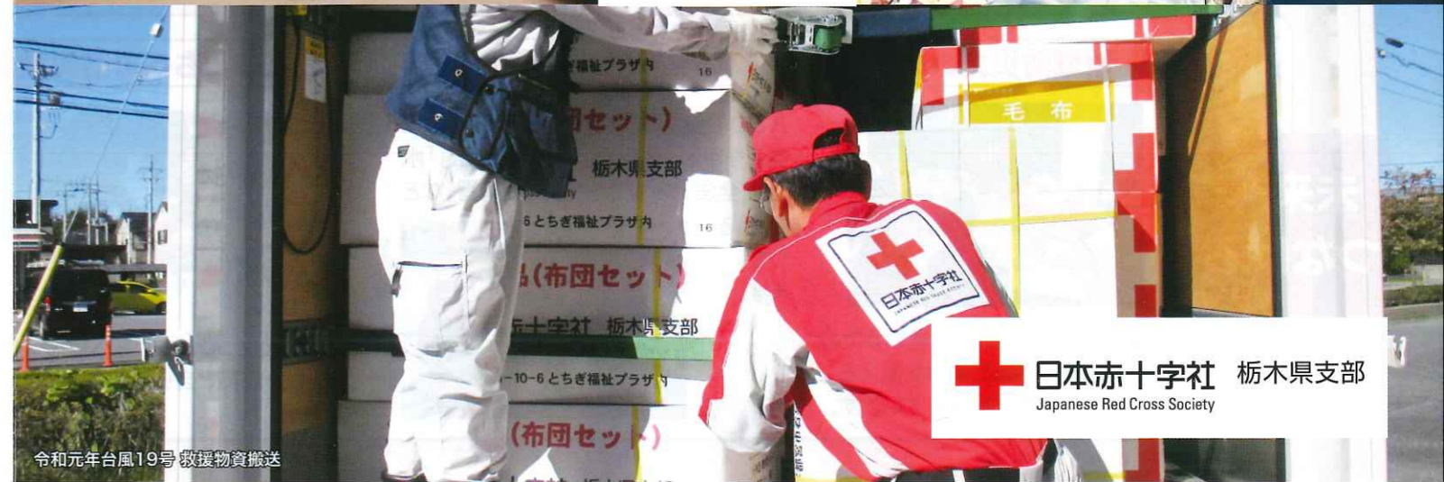
令和元年台風19号 救援物資搬送