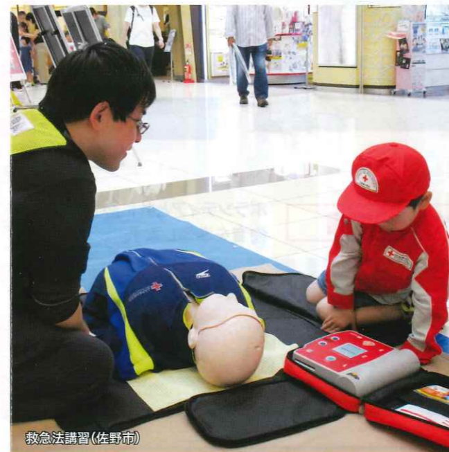
救急法講習(佐野市)

皆様の温かいお気持ちとともに これからはもひたむきに 救うことをつづけてまいります。