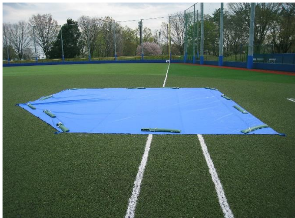
↑ 1 塁ベース