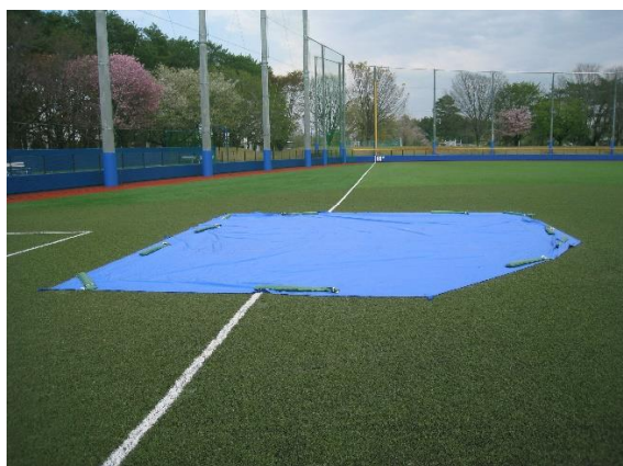
↑ 3 塁ベース