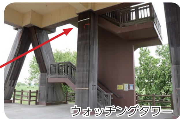
ウォッチングタワー

普段はスポーツが楽しんでいる運動公園も、非常時には大きなプールとなって水を溜め、洪水から人々の暮らしを守ります。谷中湖近くにある「ウォッチングタワー」には、 台風19号時の水位 が刻まれています。