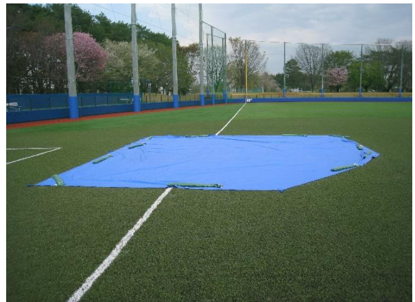
↑ 3 塁ベース