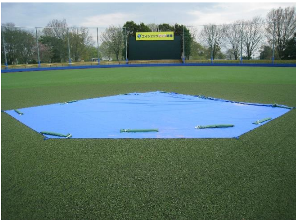
↑ 2 塁ベース