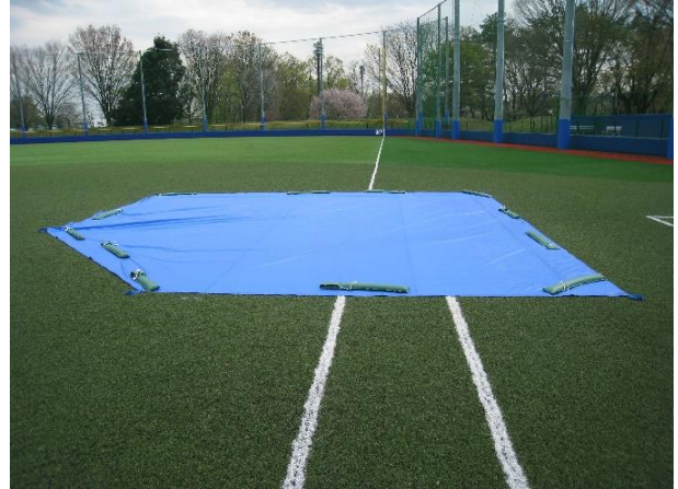
↑ 1 塁ベース