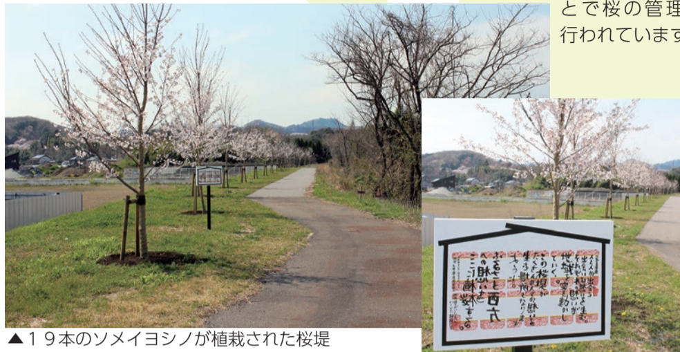
▲19本のソメイヨシノが植栽された桜堤

西方地域に新たな桜の木が植樹されました。この桜の木は、西方町金崎にあるかっぱ広場西側の堤防沿い、栃木県が行った思川の河川堤防工事により整備された堤に植栽されました。地元の商工会関係の若手有志による「にしかた桜堤の会」の協力のもとで桜の管理が行われています。