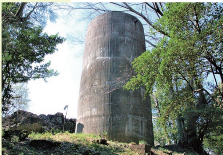
▲磯山頂上に残る巨大な水槽

磯山と不思議な建造物 大平運動公園の東、永野川沿いにある磯山は、一部の人の間では「県内一低い山(標高51m)」として知られます。中腹には諏訪神社が鎮座し、地域の人からは磯山神社として親しまれています。その山頂付近には円筒状の建造物があります。これは、昭和18年に、(株)日立製作所栃木工場が操業を開始した際、工場への水の供給のために建造された水槽で、昭和40年まで重要な役割を果たしていたとされ、現在は、諏訪神社と(株)日立製作所栃木工場によって保存されています。