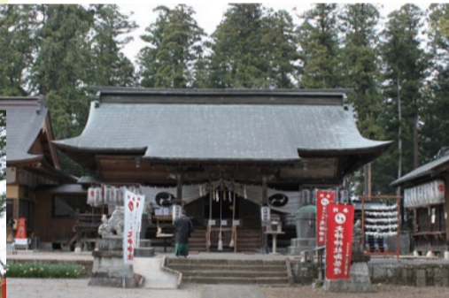
▲創建は約1800年前頃と伝えられています