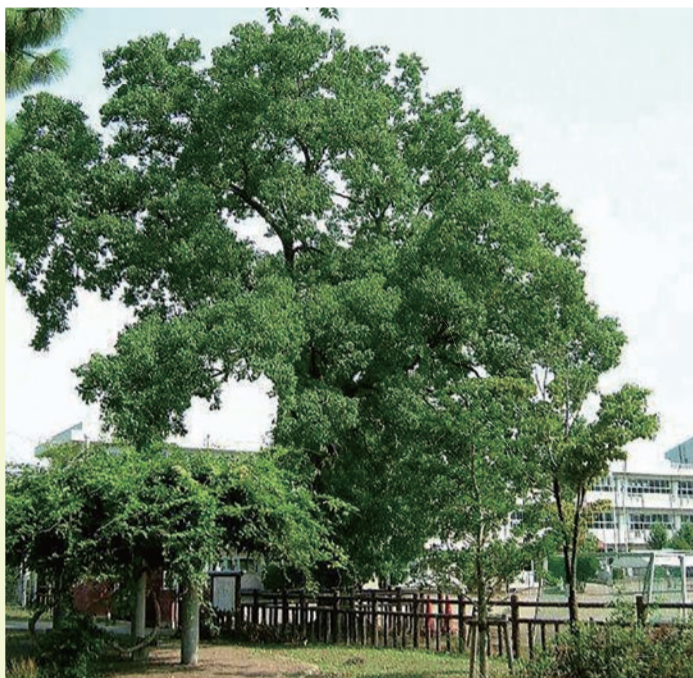
◀地域住民に親しまれるなんきんはげの木

岩舟町静戸にあるこの古墳は、県文化財に指定されており、後期古墳時代のもものと推定されています。この古墳は東側に広大な水田耕作を営む人々の豪族の墳として築かれたものと考えられています。上田下方墳という、日本でも類例の少ないめずらしい墳形式と言われています。