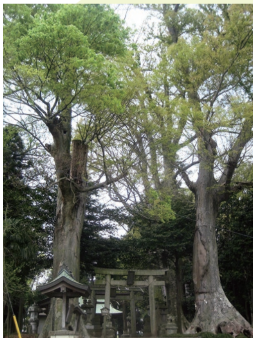
鳥居を囲むように立つ2本の大櫨▶

社殿の正面左右に立つ2本の大櫨は、推定樹齢約400年。平成元年に栃木県名木百選に選定されました。また、境内には芭蕉の句碑もあり、長い歴史が感じられます。