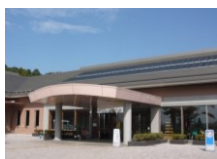
岩舟健康福祉センター