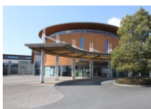
大平健康福祉センター