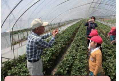
地元いちごハウス見学