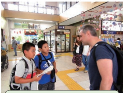
校外学習は外国人と交流