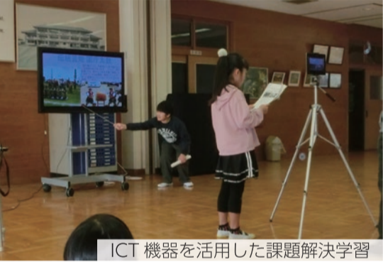
ICT 機器を活用した課題解決学習

発想を変える『きっかけ』を 「oneclass」では、それぞれの専門家が「アンガーマネジメント」や「プログラミング」など、小学生が普段は馴染みのないような授業を行っています。単に面白い内容を、というわけではなく、個人や学校の課題を意識して内容を考えています。例えば、少人数の学校だからこそ、お互いが身近になり、感情をぶつけずしてしまいうこともありません。そこで「アンガーマネジメント」を学ぼう、という事です。