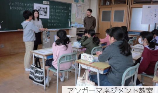
アンガーマネジメント教室