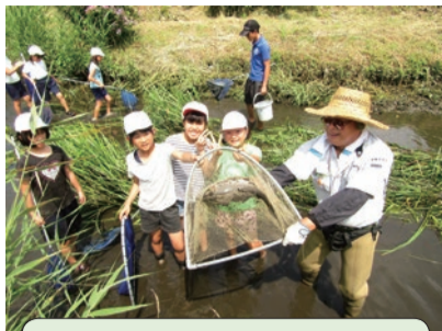
水辺の活動(自然体験)