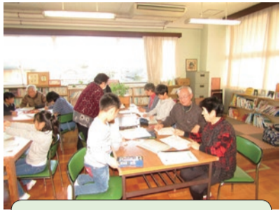
放課後教室・学習支援