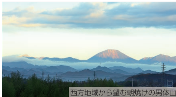
西方地域から望む朝焼けの男体山