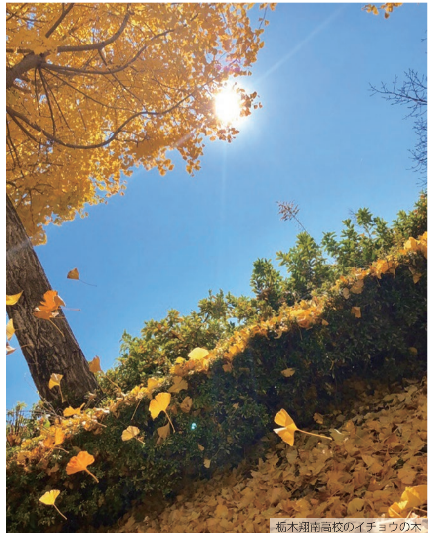
栃木翔南高校のイチョウの木