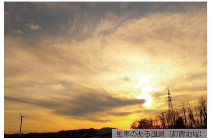
風車のある風景 (都賀地域)