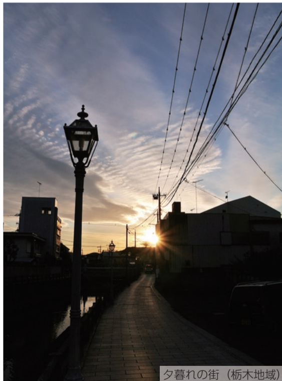
夕暮れの街 (栃木地域)