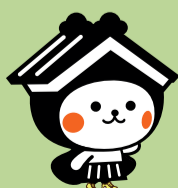
栃木市マスコットキャラクターとち介