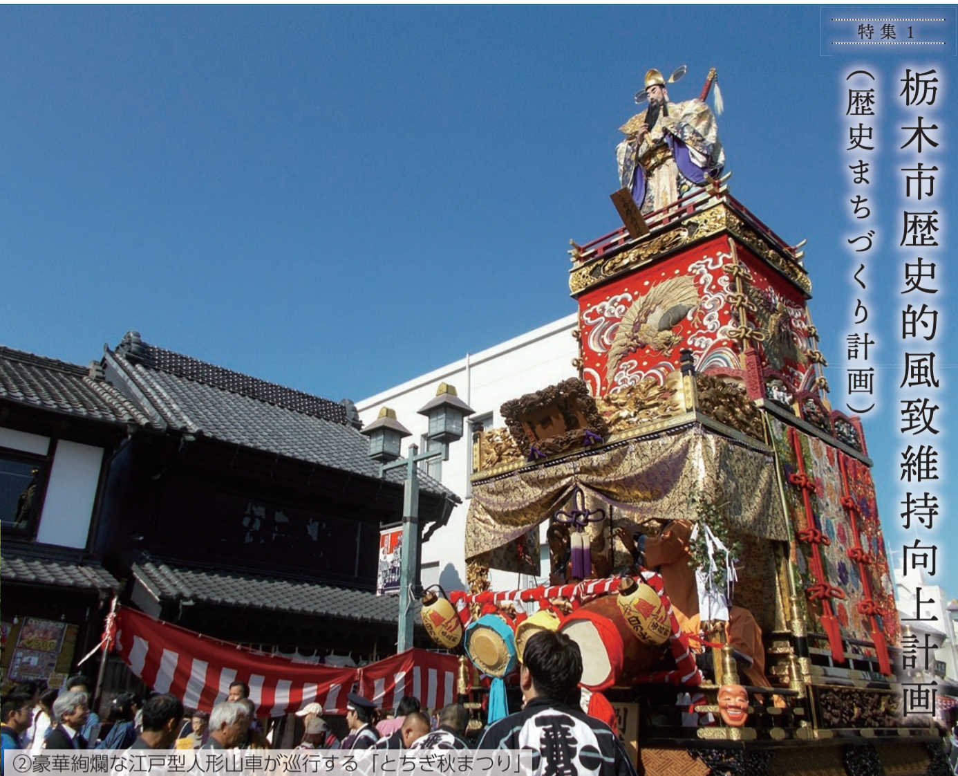
②豪華絢爛な江戸型人形山車が巡行する「とちぎ秋まつり」