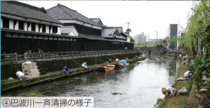
④巴波川一斉清掃の様子