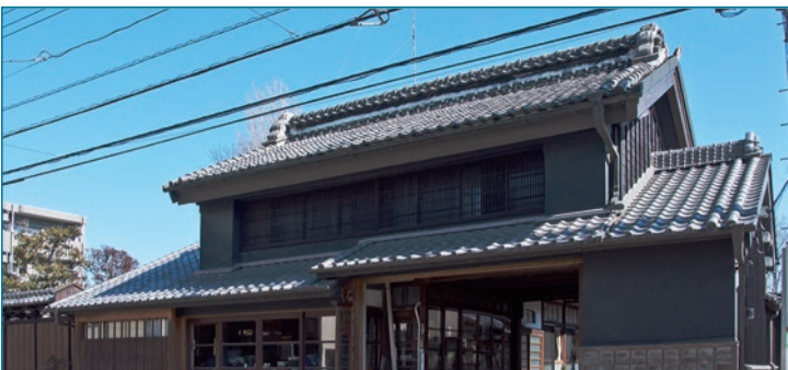
①問屋(肥料商)の見世蔵