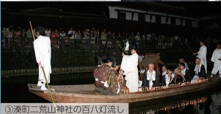
③湊町二荒山神社の百八灯流し