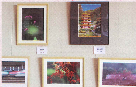
写真 感動の場面を写真に! 〈年4~5回〉