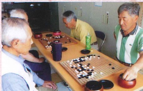
囲碁 囲碁は頭の体操。初心者歓迎。 〈毎週金曜 9時〜〉