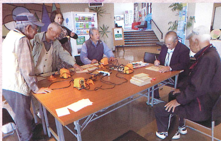
墨彩会 (水墨画・焼絵) 心に残る風景や花を楽しく描きましょ。〈第1・3・5 金曜〉