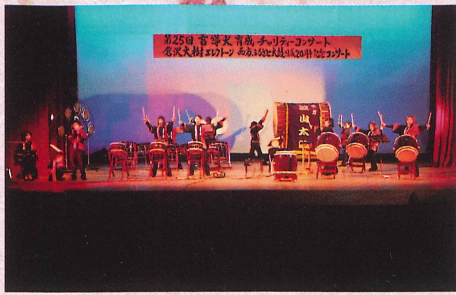
西方ふるさと太鼓 創作太鼓を後世につなげよう。 〈毎週水曜 19時30分〜〉