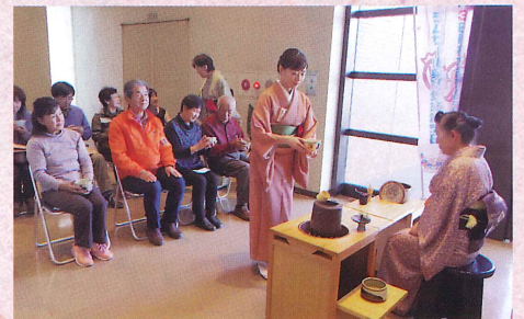
茶道・若菜会 季節のお菓子とお茶で和みませんか。 〈第2・4土曜〉 (茶道) 楽しくお茶を学んで日々のストレス解消。〈月9回 (月金土)〉 (若菜会)