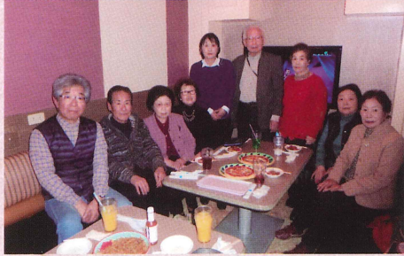
ひまわり会 (カラオケ) 笑顔で楽しく歌ってます。 〈月3回 月曜〉