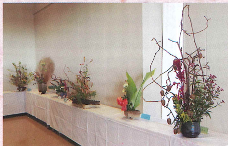
月見会 (華道) 庭先や道端に咲く自然の花を挿す。 〈月1回 (18日)〉