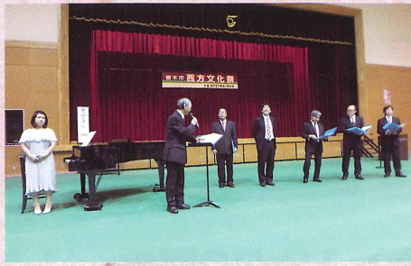
カッパーコール (男声合唱) 歌好きの男性の集まり “乞うご期待”