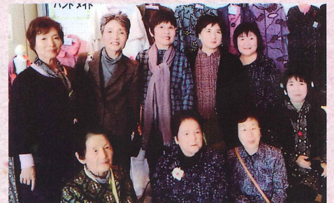
ハンドメイド 和気あいあいと布を使って作品作り。入会歓迎。〈第2・4 木曜〉