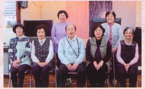
コミ・カラ会 歌詞をよく読んで歌うようにしています。〈月3回 火曜〉