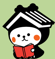
栃木市マスコット キャラクターとち介