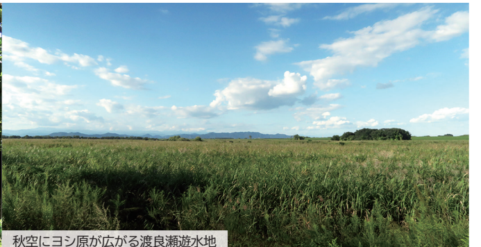
秋空にヨシ原が広がる渡良瀬遊水地