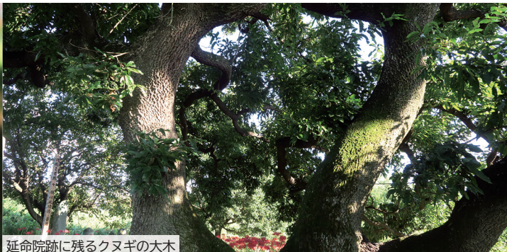
延命院跡に残るクヌギの大木