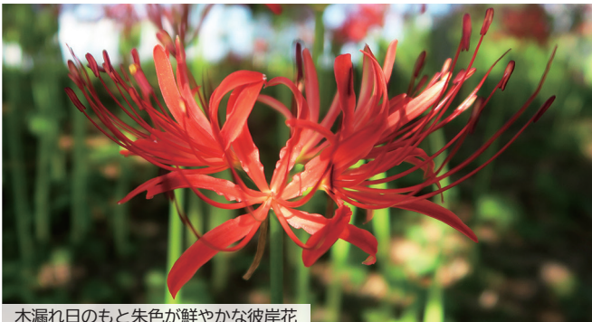
木漏れ日のもと朱色が鮮やかな彼岸花

渡良瀬遊水地内「谷中村史跡保全ゾーン」の「延命院跡」では、毎年9月下旬頃、彼岸花が一齐に咲き誇ります。この地に残るクヌギの大木の木漏れ日が、朱色の可憐な花々を柔らかかに照らし出し、往時の名残を今に伝えていきます。 (16頁に関連記事)