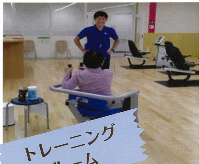
トレーニング ルーム