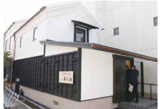
▲ 蔵を活かした移住体験施設