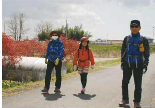
▲ ウォーキングを楽しむ参加者