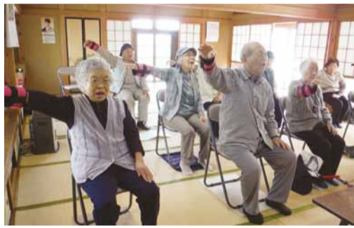
◀ 右手におもりをつけた運動