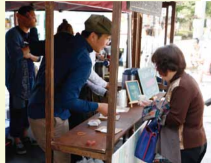
▲ 来場者にコーヒーが振舞われました

蔵の街大通りに、市で二つ目の移住体験施設がオープンしました。公募により「IJUテラス 蔵人館」と名付けられたこの施設は、築162年を迎える見世蔵と土蔵を活用した、全国的にも珍しい、カフェ併設型の移住体験宿泊施設です。3月29日には記念式典を開催し、蔵人館の内覧と、出店を予定するカフェによるコーヒーの試飲などが行われました。