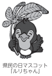
県民の日マスコット「ルリちゃん」

栃木県では、郷土への理解と関心を深めること等を目的に、6月15日を県民の日と定めています。