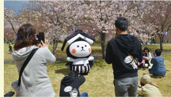
◀ とち介と一緒に桜を楽しみました

つがの里で桜を満喫 4月1日から4月15日まで、つがの里花彩祭2018が開催されました。土曜日のつがの里では、お宝探し大会やヒーローショーなど多彩なイベントが開催され、市内外から訪れた多くの来場者で賑わっていました。