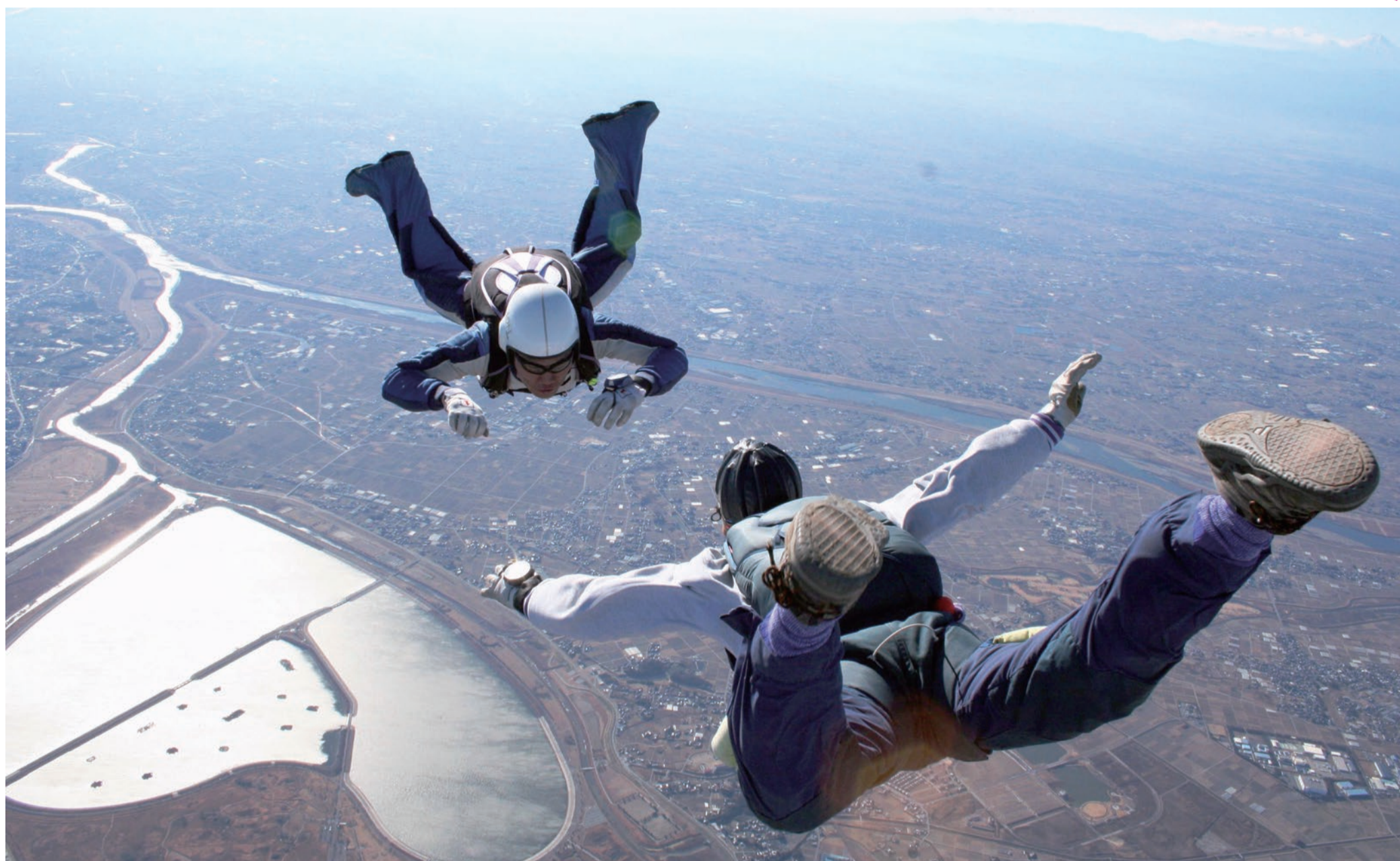
渡良瀬遊水地上空でのスカイダイビング

発行/栃木市 〒328-8686 栃木県栃木市万町 9-25 編集/総合政策部シティプロモーション課 ☎0282-21-2316 http://www.city.tochigi.lg.jp