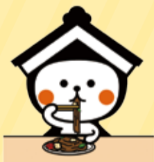
じゃがいも入り 焼きそば

※今回は、個人の方への配布は行っておりません。 ※①～③について、詳しくは問合先へ。問合先 シティプロモーション課 ☎(21)2172