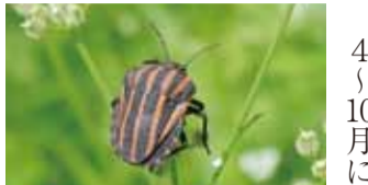
▲アカスジカメムシ