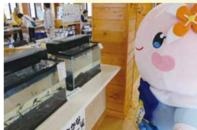
▲ おさかなと触れ合えるコーナーも