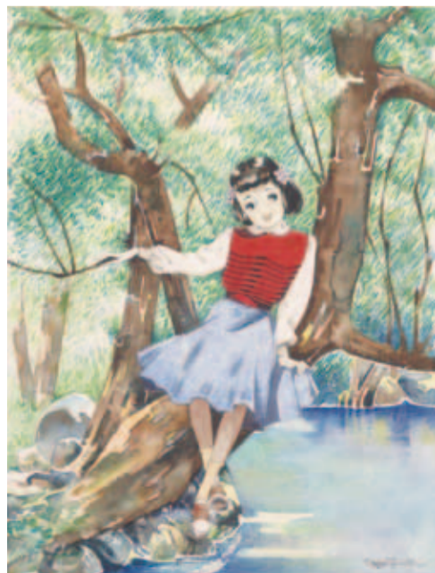
写真図版：松本かつぢ《水ぬるむ》昭和26年(1951) 松本かつぢ資料館蔵 ©松本かつぢ