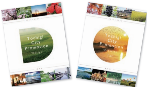
昨年度策定した、シティプロモーション・デザイン(左)とクリエイション1st(右)市ではこちらに基づいて、シティプロモーションを推進しています。こちらの内容は、市内各施設や市ホームページなどでご覧いただけます。

今回の特集は「〜aru〜 栃木市の『ある』を知ろう」と題し、栃木市のシティプロモーションの取り組みについてご紹介します。 2頁特集に続く