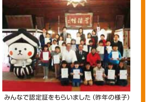
みんなで認定証をもらいました(昨年の様子)