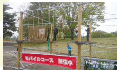
▲ 県内初のモバイルアスレチック

春の新しいイベント「大平わいわいテラスのさくらフェス」 4月7日8日、おひら桜まつりに合わせて、大平地域まちづくり実働組織「大平わいわいテラス」主催の春の新しいイベント「大平わいわいテラスのさくらフェス」が開催されました。会場では、県内初となるモバイルアスレチックのほか、手作りのとん汁うどんや、ものづくり体験のブースが設置され、テラスのメンバーは、来場者やメンバー同士の交流を深めながら、春の新しいイベントを盛り上げていました。