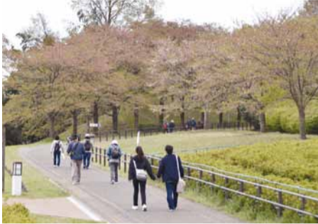
▲ 西方ふれあいパーク内をウォーキング

4月8日、昨年に引き続き西方地域の桜の名所を巡るウォーキングスタンプラリーが開催されました。今年は桜の開花が早かったため、見ごたえのある桜とはなりませんでした。参加した皆さんは、西方地域の豊かな田園風景など西方各所の春の景色を満喫しながら、ゴールとなる道の駅にしかたまでの約10kmのウォーキングを楽しみました。