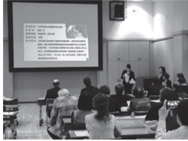
公開プレゼンテーションの様子

この制度は皆様や企業、団体からの温かい寄附金が、その原資となつていきます。昨年度も市民協働まちづくりファンドに、総額2,052,998円もの寄附をいただきました（ふるさと納税含む）。皆様からのご支援が、栃木市やそこで活動する団体をさらに輝かせるエネルギーになつていきます。ご協力、大変ありがとうございました。