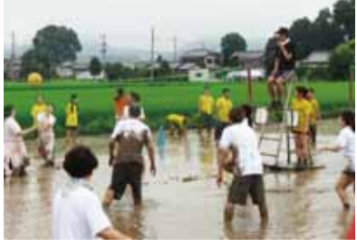
白熱のどろんこバレー!