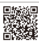
栃木市シティプロモーション YouTubeチャンネル

文化・歴史・食・体験……様々なものがあふれる栃木市の魅力を ぎゅっと凝縮。臨場感あふれる動画で あなたも栃木市体験を。