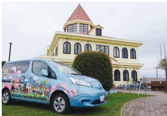
▲ とんがり屋根のハートランド城

栃木市の渡良瀬遊水地におけるシンボル施設として整備が進められてきた「栃木市渡良瀬遊水地ハートランド城」が4月1日にオープンし、ハートランドの歴史に新たな1ページが刻まれました。オープンを記念して4月7日と8日にイベントを開催し、来場した方に、展示物の鑑賞やミニヨシズづくり体験などを楽しんでいただきました。今後は、渡良瀬遊水地の各種情報発信や人材育成のための重要な拠点として活用していきます。