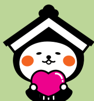
栃木市マスコットキャラクターとち介