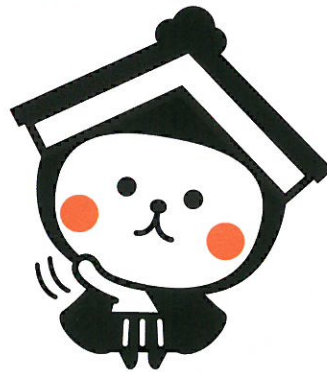
栃木市マスコットキャラクター とち介