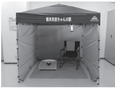
イベント会場等へ貸出可能な移動式赤ちゃんの駅