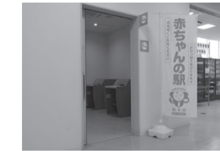
市役所本庁舎1階市民スペースの横にもあります

登録している施設では、営業・業務時間中は自由におむつ替え台や授乳のためのスペースを利用できます。施設の目印として、赤ちゃんの駅ののぼり旗やステッカーがあります。また、市ホームページ上にも施設のQRコードが