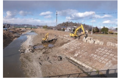
護岸工事の様子(園部町付近・2月撮影)

中・下流部を含め、工事に係わる諸調整が整った区間より順次着手する予定です。また、河道改修に伴い改築となる橋梁や取水堰についても、早期の工事着手に向け、詳細設計を鋭意進めています。