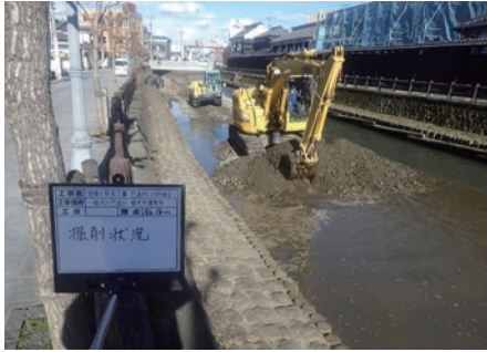
令和2年度は、出水期前に堆積土除去工事を行いました(湊町・令和2年5月撮影)

今後、地下捷水路が完成するまでの間に、当区間およびその下流域について対策が必要な箇所を見極め「河川内の堆積土砂の掘削」や「堤防強化」の工事を行います。